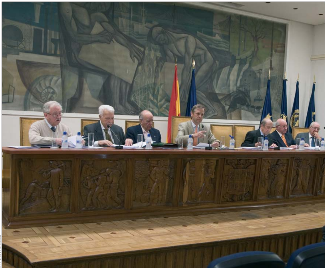
La mesa presidencial de la Junta Extraordinaria, celebrada el pasado 11 de abril.

A diferencia de los compañeros que se han citado (que han estado dispuestos a emplear su tiempo en conseguir que el Colegio vuelva a su funcionamiento normal), los promotores de la campaña de recogida de firmas se han desentendido de este objetivo, dedicándose únicamente a derribar a la Junta Directiva. Incluso por alguno de ellos se ha llegado a proponer el impago de las cuotas, alegando que este acto doloso no tiene efectos personales hasta transcurridos dos años (art. 69 del anterior Reglamento, actualmente sin validez).